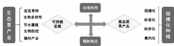
图1 河西走廊生态化与规模化草业发展模式

二是打造甘南草原生态旅游示范区,探索草原生态型草畜牧游综合发展模式。坚持以草定畜,加强草场利用和管理,逐步提高草原生态补奖政策禁牧补助和草畜平衡奖励标准,并采取季节轮牧、草场划区轮牧等方式,严防超载过牧,减轻草场放牧压力,力促草畜平衡发展。打造地方绿色有机畜产品品牌,发展高端畜产品生产。大力发展草原旅游业,通过旅游带动地方高端畜产品消费和宣传,不断提高知名度。